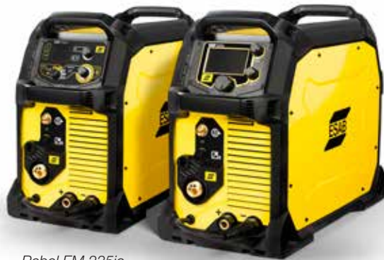
Rebel EM 235ic